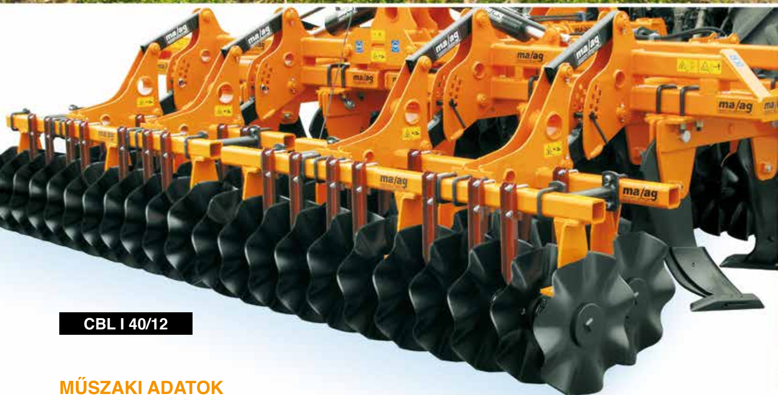
CBL I 40/12