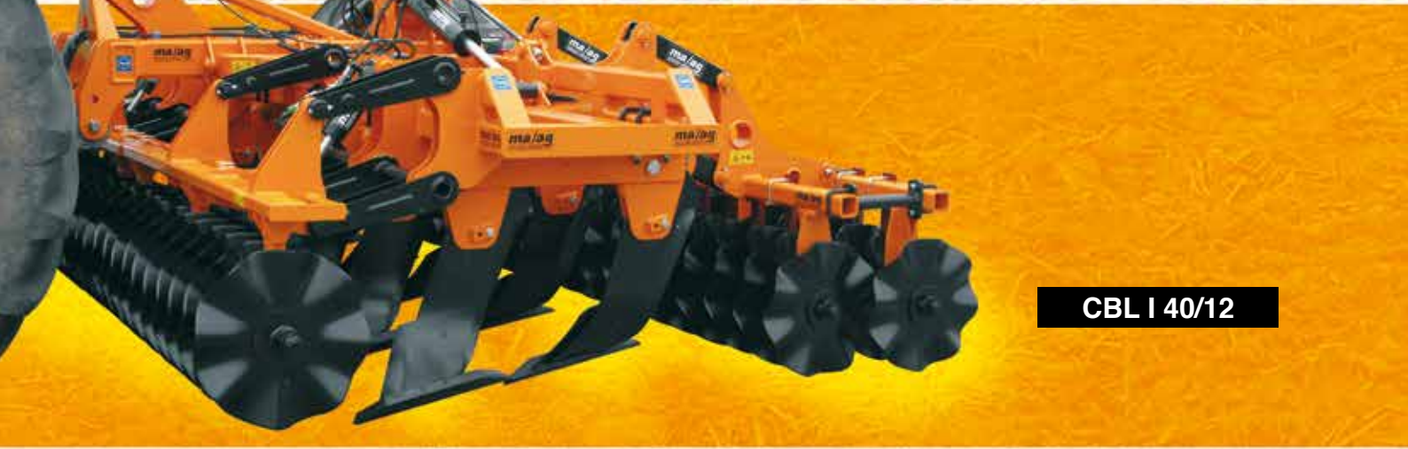
CBL I 40/12